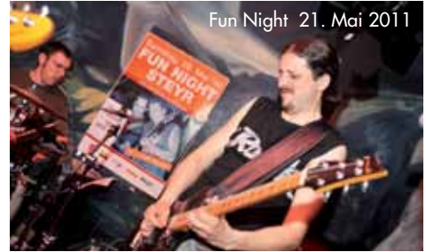
Fun Night 21. Mai 2011