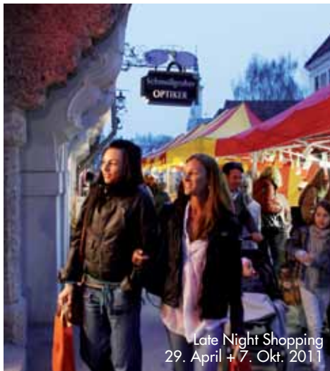
Late Night Shopping 29. April + 7. Okt. 2011

Angaben vorbehaltlich Änderungen und ohne Gewähr