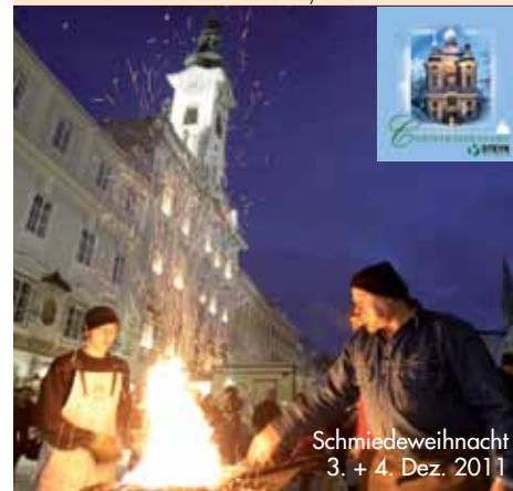
Schmiedeweihnacht 3. + 4. Dez. 2011